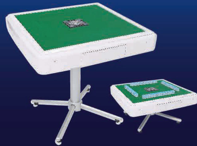
家庭用全自動麻雀卓