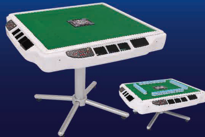
家庭用全自動点数表示麻雀卓