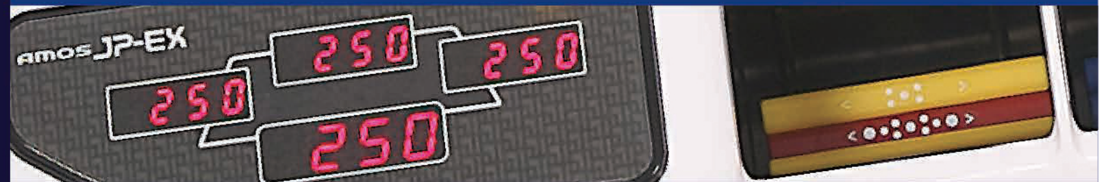
家庭用全自動点数表示麻雀卓